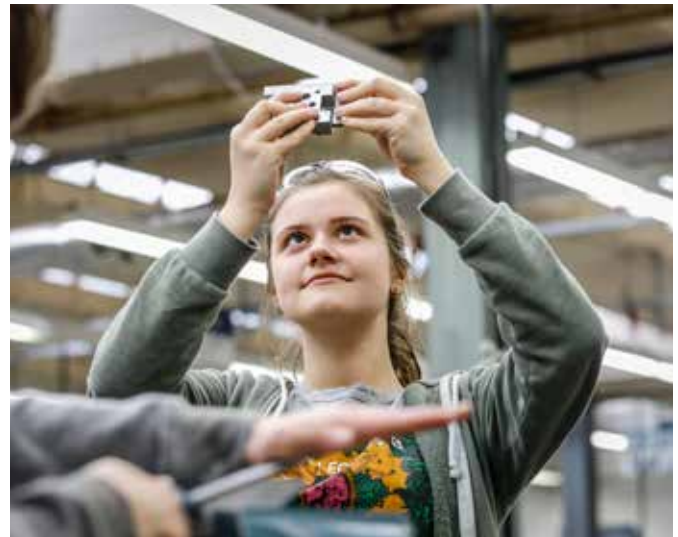
Fachkräfte in Handwerksberufen dringend gesucht: Hier nimmt eine Werkstoffprüferin in der Grundausbildung eine Qualitätssicherung vor.