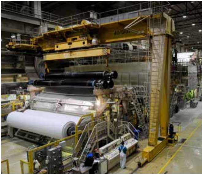
Volle Lager: Weil die Papierpreise um mehr als 200 Prozent gestiegen sind, haben Verlage wie die Nürnberger Presse ihren Vorrat verdreifacht.

drastische Maßnahme sind extreme Preissteigerungen. Ende 2021 kostete die Tonne Zeitungspapier durchschnittlich rund 360 Euro. Ein Jahr später waren es fast 1000 Euro. Die Erklärung: Papier herzustellen ist sehr energieintensiv, in der Vergangenheit haben zahlreiche Werke auf günstiges Gas gesetzt und es verstromt. Inzwischen ist das Gas zwar wieder günstiger geworden, die Papierpreise sind aber hoch geblieben. Pickl hat allerdings rechtzeitig vorgesorgt. Am Nürnberger Hafen zwischen Bahngleisen und Schifflanlegestellen lagert eine Logistikfirma Papierrollen für das Druckhaus. Normalerweise liegt dort ein Vorrat für maximal vier Wochen, jetzt reicht er für ein Vierteljahr. Niemand wollte früher ein großes Lager, weil das mehr Geld kostet, heißt es vom Verlag. „Aber im Vergleich zu den Papierpreissteigerungen sind das Peanuts.“