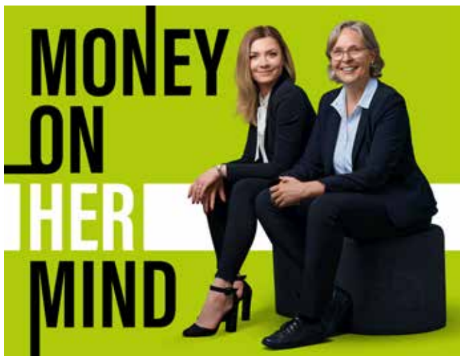
Money on Her Mind: der zweiwöchentliche Podcast für Frauen zum Thema Geld.