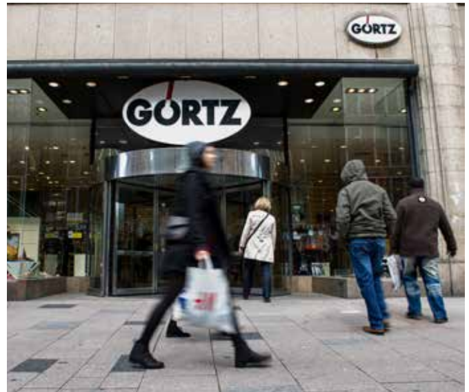
Görtz: Nach der im September angemeldeten Insolvenz hat die Schuhhandelskette Läden geschlossen und sucht nun einen neuen Investor.

Der Rückenwind, der die großen börsennotierten Konzerne durch die Krise trägt, und dessen Ursache vor allem in höheren