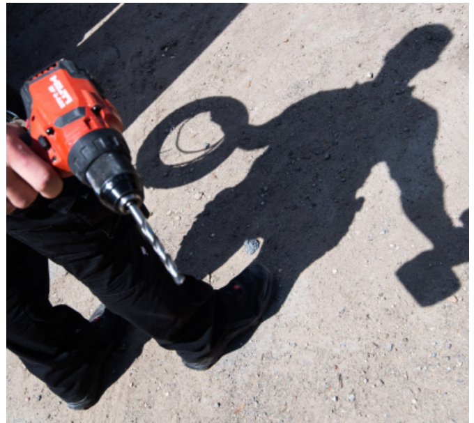
Demografie beschleunigt Fachkräftemangel in Deutschland: Bis 2060 könnte die Zahl der Menschen im erwerbstätigen Alter auf 34 Millionen sinken.