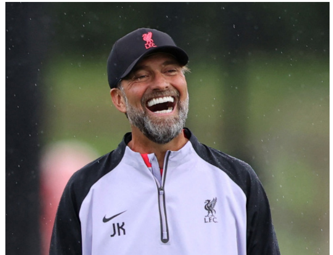
Bei der Produktion einer neuen Werbekampagne hat Jürgen Klopp gut gelacht: Dank KI wurde Klopps Stimme synthetisiert und sein Gesicht digitalisiert.